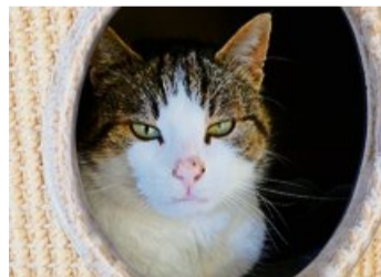
Häxli ist eine selbstbewusste und eigenständige Katze.