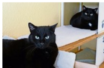
Gina und Mina sind anhänglich und verschmust.

länder Tierheimen vorgestellt, die ein neues Plätzchen suchen. Bei Interesse setzen Sie sich direkt mit dem entsprechenden Tierheim in Verbindung. Tierschutzheim im Heuel, Rümlang Telefon 044 817 24 22, www.tierschutzheim.ch